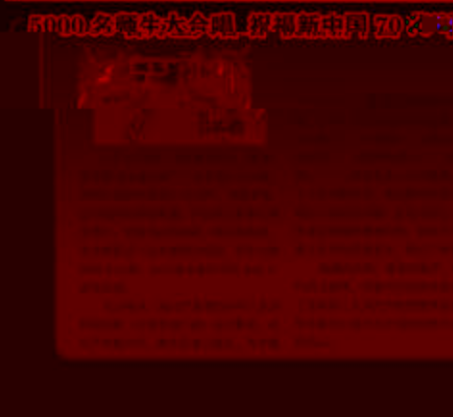
5000名师生大会唱 庆祝新中国成立70周年